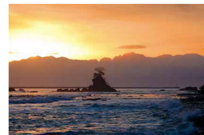
とやま 富山湾 (富山県)