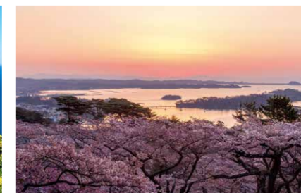
まつしま 松島湾 (宮城県)