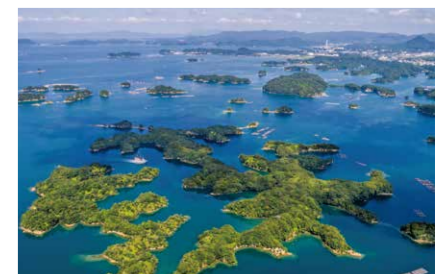
くじゅうくしま 九十九島湾 (長崎県)