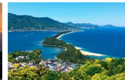
みやづ いね 宮津湾・伊根湾 (京都府)