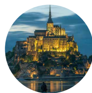
モン・サン・ミシェル湾 (フランス)