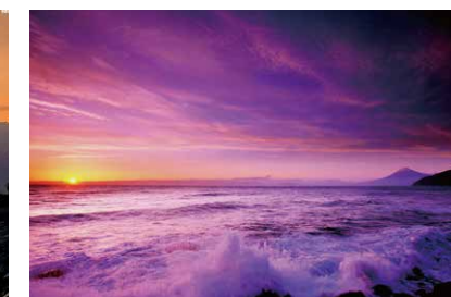
するが 駿河湾 (静岡県)