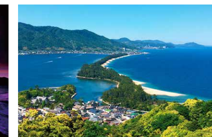
みやづ いね 宮津(湾)・伊根湾 (京都府)