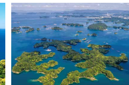
くじゅうくしま 九十九島湾 (長崎県)